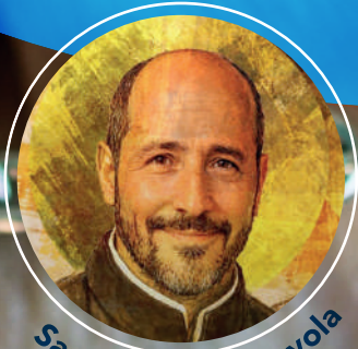
San Ignacio de Loyola