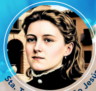
Sta. Teresita del Niño Jesús